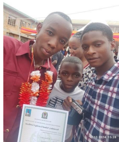
Dotto hat den Realschulabschluss